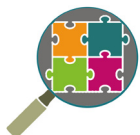
TABLEAU DES DERNIERS TRAVAUX EN NORMANDIE DE LA MISSION D'ANALYSE PROSPECTIVE AFPA